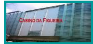
❖ CASINO DA FIGUEIRA / FIGUEIRA DA FOZ