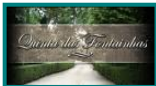
❖ QUINTA DAS FONTAINHAS / SANTO TIRSO