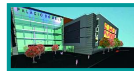
❖ VISABEIRA / C.C. PALACIO DO GELO / VISEU