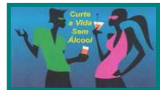
❖ CENTRO REGIONAL ALCOOLOGIA DO NORTE / PORTO