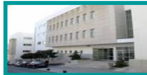
❖ CÂMARA MUNICIPAL LOUSADA / LOUSADA