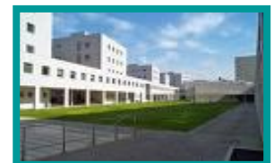
❖ FEUP / PORTO