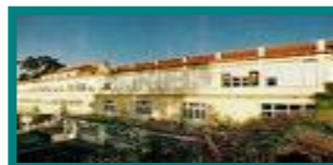
❖ HOSPITAL PEDIÁTRICO DE COIMBRA / COIMBRA