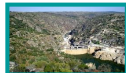
❖ HIDROELECTRICA DO PICOTE