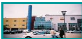
❖ NORTE SHOPPING / PORTO