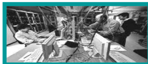
❖ SIEMENS / I & D