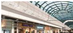
❖ BRAGA RETAIL PARK