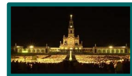
❖ SANTUARIO / FÁTIMA