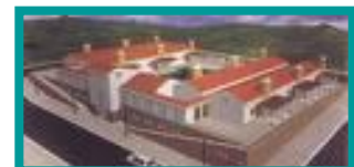
❖ LAR 3ª IDADE / COVILHA