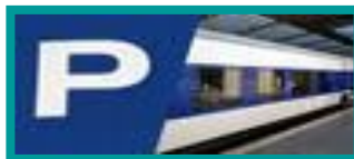
❖ PARQUE ESTACIONAMENTO / COIMBRA