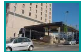
❖ HOTEL EGATUR / MAIA