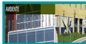
❖ SONAE SIERRA / C. COGERAÇÃO / NORTE SHOPPING