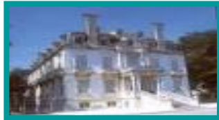
❖ PALACIO SOTTO MAYOR / FIGUEIRA DA FOZ